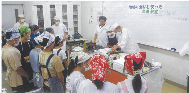
地域の食材を使った料理教室