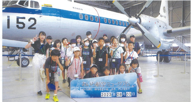
大空を飛んだ実機に触れ、大きさを体感!!