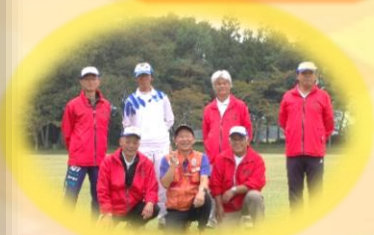
愛東地区スポーツ協会役員と高野先生