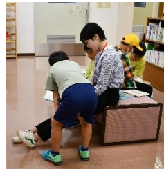
先生も一緒に読もう!