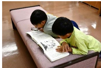
↑ 何人でも見て楽しいね。 ↓

ふたごの野ねずみが主人公の絵本『ぐりとぐら』が出版されて今年でなんと60年! シリーズの絵本その他、作者の中川李枝子さん、山脇百合子さんの著書や絵本に出てくるおいしいお菓子のレシピ本などをご紹介します。世代を超えて楽しめるコーナーです。ぜひご覧ください。