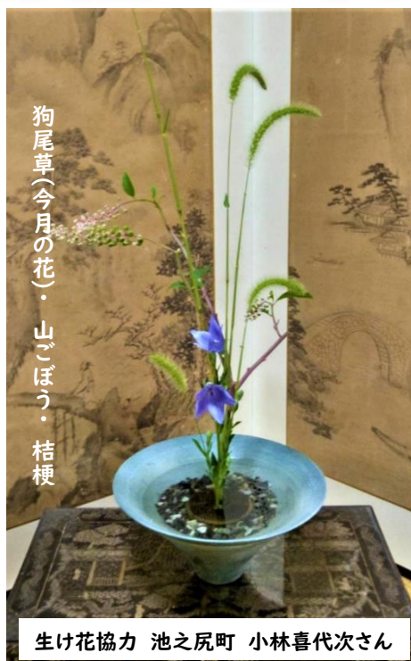
狗尾草(今月の花)・山ごぼう・桔梗

今月は狗尾草(エノコログサ)をご紹介します。エノコログサは、ユーラシア大陸原産のイネ科エノコログサ属の植物で、草丈は40センチ〜70センチの一年生草本です。古くから食用として用いられている粟の原種で、日本には縄文時代前期に、粟(あわ)の栽培に伴って畑の雑草として渡来したようです。エノコログサという名前は、夏から秋にかけてつけるふさふさした花穂が子犬の尻尾のように見えるため「犬っころ草」と呼ばれたものが転じて「エノコログサ」という呼称になったとされます。漢字でも「狗(犬)の尾のような草」という意味で「狗尾草」と表記されます。(参考:Wiki・暮らし)