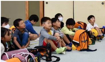
みんな熱心にお話を聞いていました。

図書館にあるさまざまな本についての紹介や読み語りを聞いた後、思い思いに本を楽しみ、貸出の体験もしました。