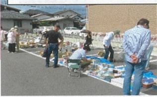
第1回のマーケット(9/23)