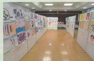
各種団体・サークルの皆さん、一般の方の作品