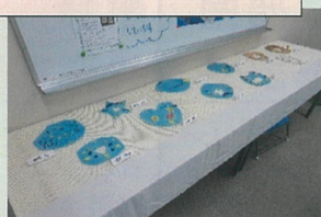
子どもたちの作品