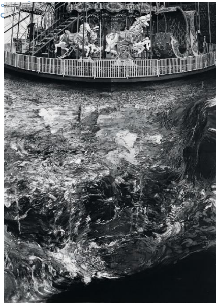
タイトル：The candle flickered in the wind サイズ：180×130cm