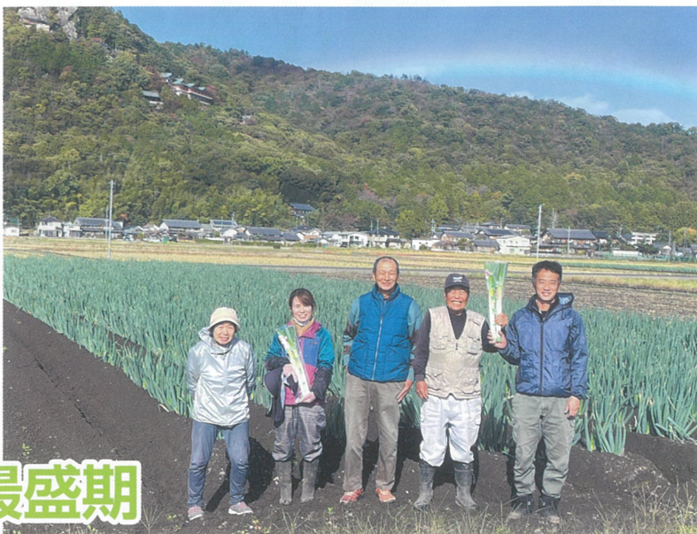
天狗葱生産農家のみなさん