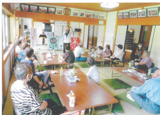
わきあいあいの「宿ふれあいサロン」