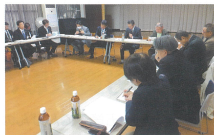
ときおり重苦しい雰囲気につつまれた「まちづくり懇談会」。宿ふれあいサロンのような、わきあいあいの集まりにしたいと思いました。

11月13日、中野コミセンにて開催。市からは市長をはじめ副市長、各部長、中野地区からはまちづくり協議会役員、自治連合会役員が出席して意見交換しました。議題は、①都市計街路小今建部上中線開通にともなう今後の道路改良と工事予定について、②各種団体役員の選出のあり方について、③市内行政全般とまちづくりの方向について意見交換しました。