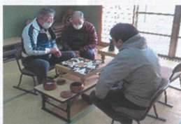
(囲碁の体験講座もしていただきました。)

第2回「南部ふれあいフリーマーケット」を開催しました。今年からの事業です。地域の皆さんに来て、出会って、お話できる場になればと思っています。