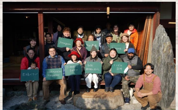
9組の出店者の皆さん。 どの出店者さんも、真心がこもった手作りのものばかりでした!(^^)!

2月23日に梅林町「だれんち？」で行われた縁側日和には、湖東三山の麓のゆたかな土地で育てられた野菜や果物などが各お店に並べられ、多くの方でにぎわいました。 次回は 4月2日(日)11:00~15:00 に開催されます。