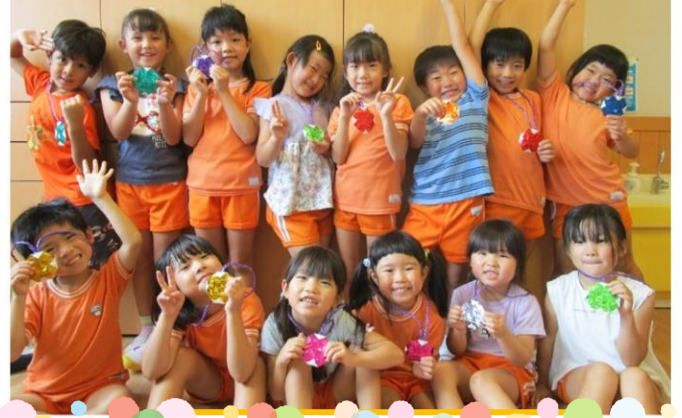
かすが保育園 卒園児