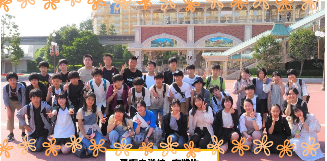
愛東中学校 卒業生