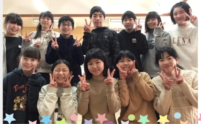
愛東南小学校 卒業生