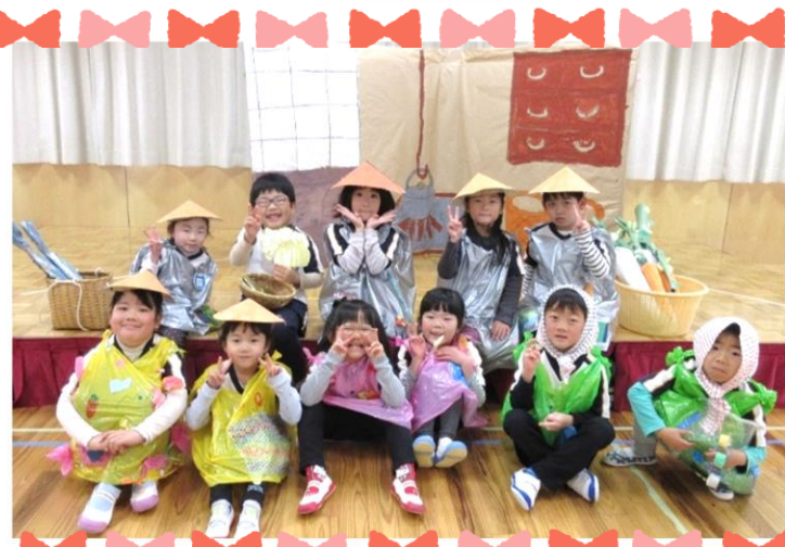
あいあい幼稚園 卒園児