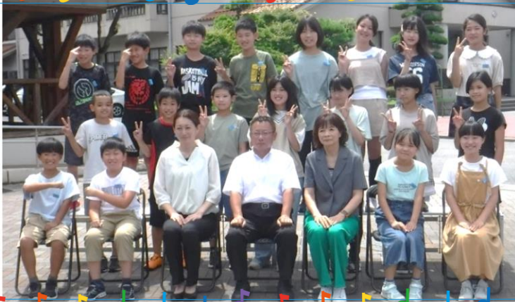
愛東北小学校 卒業生