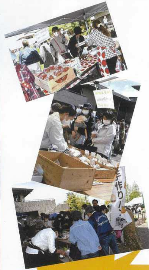
次はお惣菜マルシェを予定しています。 みなさん、来てくださいね。

4月17日（月）、愛東コミュニティセンター駐車場で「あいとう春のパンまつり」が開催されました。今回は、8つのお店に出店していただきました。10時からの販売予定でしたが、30分ほど前から駐車場は大変な人だかりでした。どのお店も大人気で、長蛇の列ができていました。終了時間を15時と予定していましたが、わずか1時間ほどで、どのお店も完売でした。お買い物をしていただいたみなさんの笑顔、出店者さんたちの笑顔がとても印象的でした。初めてのイベントでしたが、たくさんの方々に喜んでいただけてよかったです。これからも愛東地区まちづくり協議会は、たくさんの方々に喜んでいただけるようなイベントを開催していこうと思います。お楽しみに！！