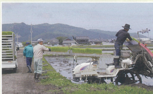
【田植えのスタート】