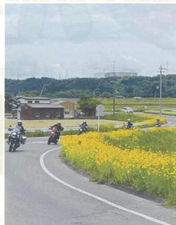
【尻無町のS字カーブ】