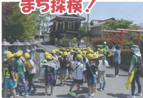
芝原・柴原南 玉緒神社

その後、玉緒神社、宮溜を見学しました。 児童たちは、宮溜の水は鈴鹿山の愛知川ダムから農業用水を引いて貯めているのに驚いていました。2時間余りでしたが、小学校周辺で新たな発見ができました。