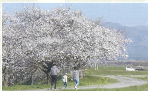
【のどかな春の散歩】