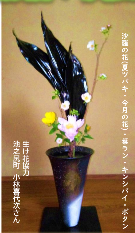
沙羅の花(夏ツバキ・今月の花)・葉ラン・キンシバイ・ポタン

故に日本の寺院などでは沙羅の木と似た夏椿の木を沙羅双樹として植えられたようです。 小学館 Domani(下マーニ)公式ウェブサイトをほか