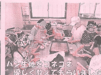
パン生地をコネコネ優しく教えてもらいました