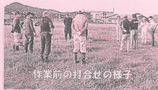
作業前の打合せの様子