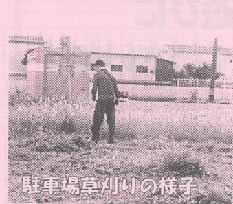
駐車場草刈りの様子