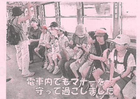
電車内でもマナーを守って過ごしました