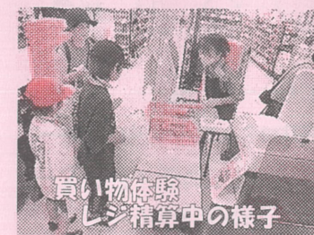
買い物体験レジ精算中の様子

図書館では司書さんに読み語りをしていただきました。アピアでのお買い物体験では、決められた金額の中で買えるものを計算しながら一生懸命探しておられました。