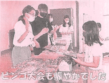
ビンゴ大会も賑やかでした