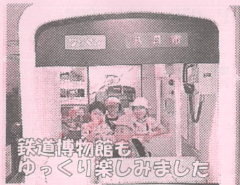
鉄道博物館もゆっくり楽しみました