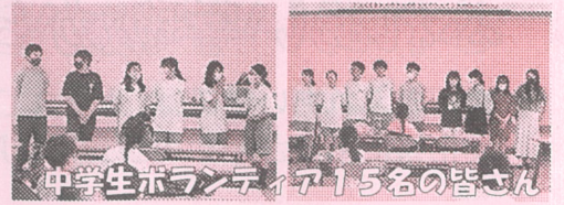
中学生ボランティア15名の皆さん