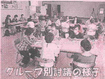
グループ別討議の様子

その後3班に分かれてのグループ別討議を行い、更生を目指しておられる方に対して地域でできる事などについて話し合いが行われました。