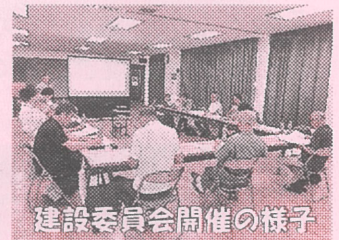
建設委員会開催の様子