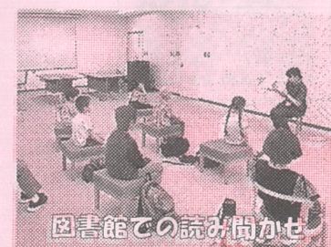
図書館での読み聞かせ

開催にあたり、船岡中学校生徒の皆さん、子ども会連合会役員の方々、地域ボランティアの皆様にご協力いただき、子ども会連合会・青少年育成会に共催いただきました。心よりお礼申し上げます。ありがとうございました。