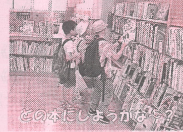
どの本にしようかな？