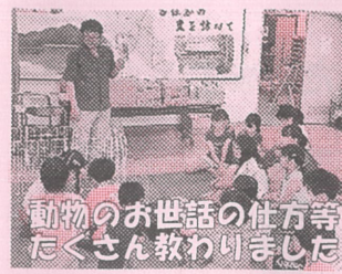
動物のお世話の仕方等たくさん教わりました