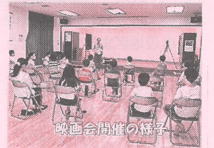
映画会開催の様子