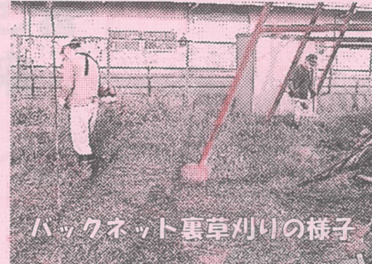
バックネット裏草刈りの様子