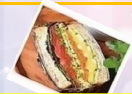
ボリュームサンド