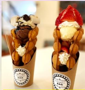
一番人気の イチゴスペシャルと チョコスペシャル