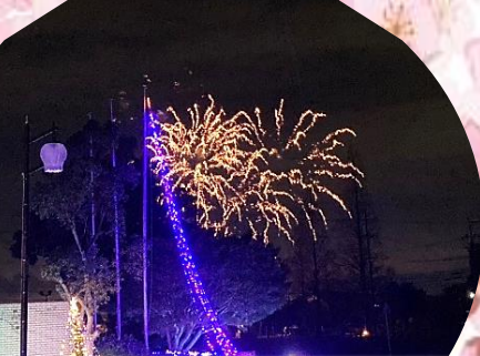
▶今年もまち協からお祝いの花火があげられました