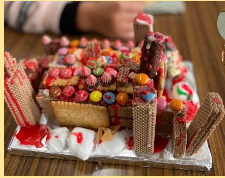
バランスとるのが難しい・・・。