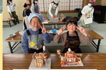
あいとういきいき子ども塾