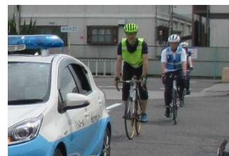
▲啓発ライドの様子