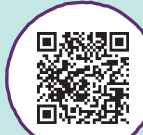
聖徳太子 公式ホームページ

問 聖徳太子1400年悠久の近江魅力再発見委員会事務局 (東近江市観光物産課) TEL 050-5801-5662 FAX 0748-23-8292