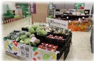
平和堂アル・プラザ八日市店（アピア）