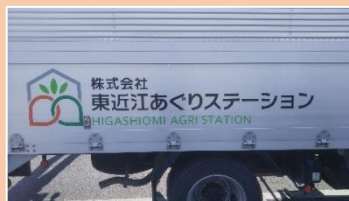
(株)東近江あぐりステーションの運搬車