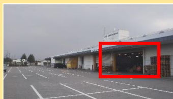
東近江市八日市公設地方卸売市場