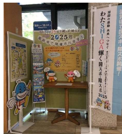
本館に設置中の啓発ブース