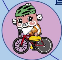
自転車 (ロード・レース)