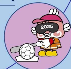
グランドソフトボール