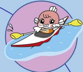
カヌー (スプリント)