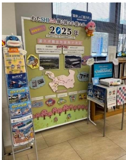
写真③ 東近江市役所新館啓発ブース