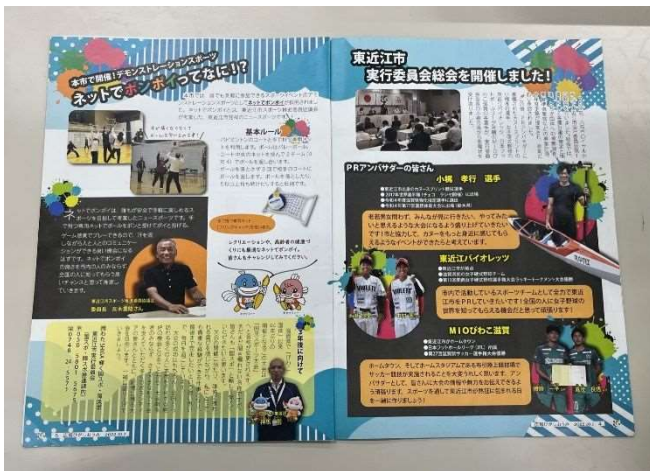
写真① 広報ひがしおうみ特集ページ