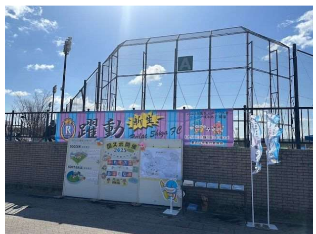
写真④ ソフトボール交流大会、フットボールリーグ