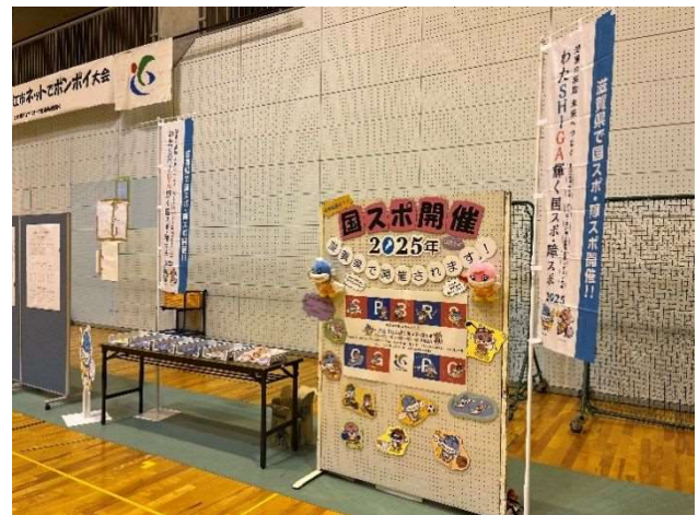
写真② ネットでポンпой大会啓発ブース