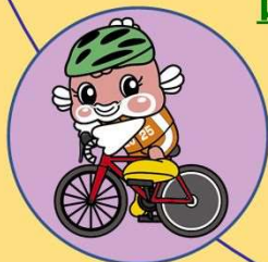
自転車 (ロード・レース)