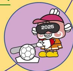
グラウンドソフトボール