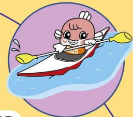
カヌー (スプリント)