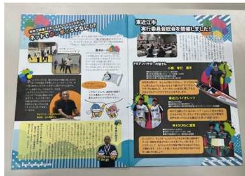
広報ひがしおうみ