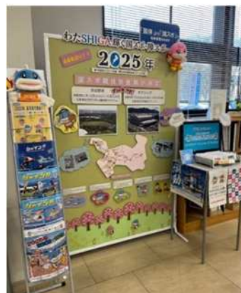
東近江市役所新館啓発ブース