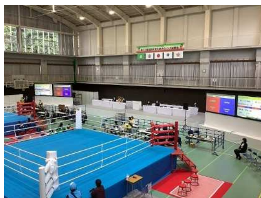
日光市 ボクシング会場