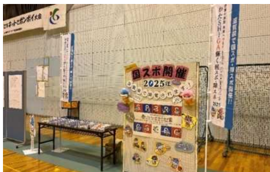
ネットでポンポイ大会啓発ブース