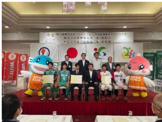
P Rアンバサダー就任式