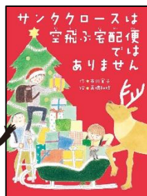
『サンタクロースは空飛ぶ 宅配便ではありません』 市川 宣子／作 ポプラ社

4年生の三太は、名前のせいで クリスマスのおねがいの手紙が集 まってきて、こまっています。そん な三太が「100万人めのサンタク ロース」にえらばれてしまい、トナ カイといっしょにプレゼントをくば ることに！