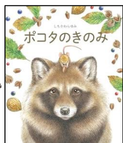
『ポコタのきのみ』 しもかわら ゆみ／作 世界文化社

ねずみ とりすは、ふゆに そなえ て つちに きのみを うめました。そ れを みた たぬきのポコタも、まね して きのみを うめました。でも、ポ コタは きが つきました。「ぼく、どこ に うめたのか ちっとも おぼえて いない！」