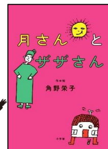
『月さんとザザさん』 角野 栄子／作 小学館

ザザさんは、毎日朝から晩までも くんばかり言っているおばあさん。 そんなザザさんの所に月さんがや ってきて、おもしろい話を聞かせて くれことになりました。さて、ひねく れもののザザさんのごきげんは、な おるのでしょうか？