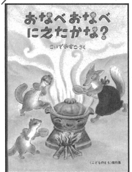
おなべおなべ にえたかな?