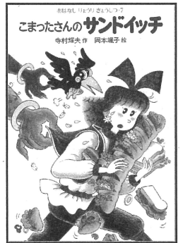
こまったさんのサンドイッチ