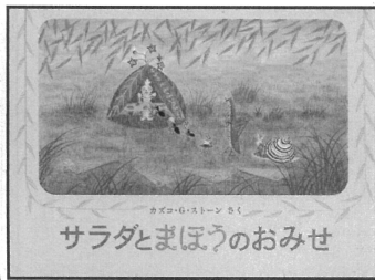
サラダとまほうのおみせ